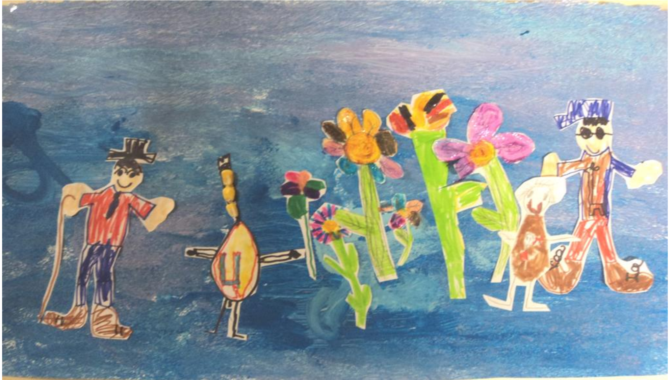
Le Grand Epi et ses enfants